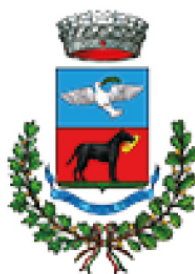
Comune di Pamparato