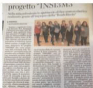
«Nel pomeriggio di venerdì 20 ottobre, presso la Casa di Riposo di "Vittorio Salvo", di Serra Pamparato si è svolto un altro prezioso incontro a cura dell'Associazione RoadeRicci. Un appuntamento a cura dell'Associazione RoadeRicci, in collaborazione con il Comune di Serra Pamparato, ha offerto loro una valida alternativa di dipendenza e aiuto. Due progetti, i grandi idee e la voglia di non disperdere il capitale umano: la rappresentazione di teatro dei piccoli borghi di montagna. Presso la sala polivalente del capoluogo montese, alla luce di un'atmosfera calda e accogliente.