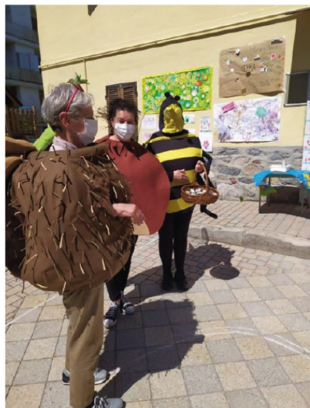
Le Roatine in visita alla Scuola dell'infanzia del Territorio: UN RICCIO, UNA CASTAGNA E UN'APE!