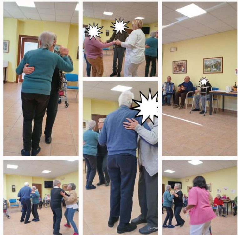
Pomeriggi danzanti presso la casa di riposo di Serra Pamparato

Questa stretta di mano e' sufficiente per spronarci ad andare avanti e essere consapevoli che facciamo Bene!