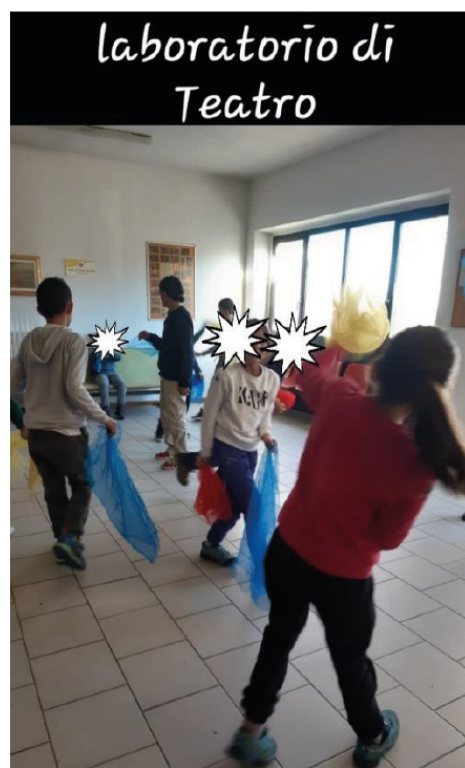
Laboratorio di giocoleria