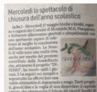
Mercoledì 17 maggio lebe e bebi, ragazzi e ragazzi del Comune di Montaldo M.A., Pamparato e Roberti all'incontro giochi e ricami con un spettacolo grazie al contributo della RoadeRicci.